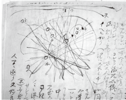
1903年7月18日付土宜法龍宛書簡(部分)